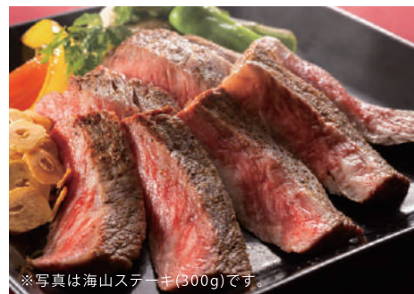
※写真は海山ステーキ(300g)です。

肉料理のお店【スプーン】では、ステーキはもちろん、牛豚鶏のセットやビーフシチューなど様々な種類・部位のお肉を使ったメニューをお届けしています。数量限定の部位や期間限定のおすすめ料理もございますので、どうぞお見逃しなく。