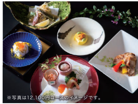
※写真は12,100円コースのイメージです。

12,100円コース…前菜、お椀、造り、焼物、煮物、酢物など全10品 9,680円コース…前菜、造り、焼物、煮物、揚物など全9品 7,260円コース…先附、造り、焼物、煮物、揚物など全9品