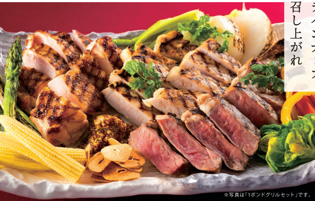
※写真は「1ポンドグリルセット」です。